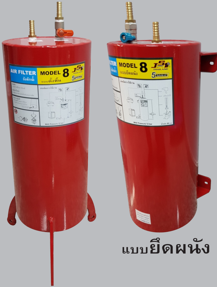
แบบตั้งพื้น